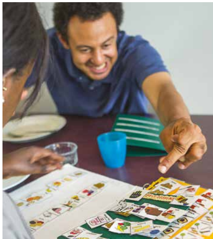
> LE CLASSEUR PECS – SYSTÈME DE COMMUNICATION PAR ÉCHANGE D'IMAGES – PERMET AUX RÉSIDENTS QUI LES UTILISENT DE FORMULER DES ENVIES ET DES BESOINS GRÂCE À DES PICTOGRAMMES