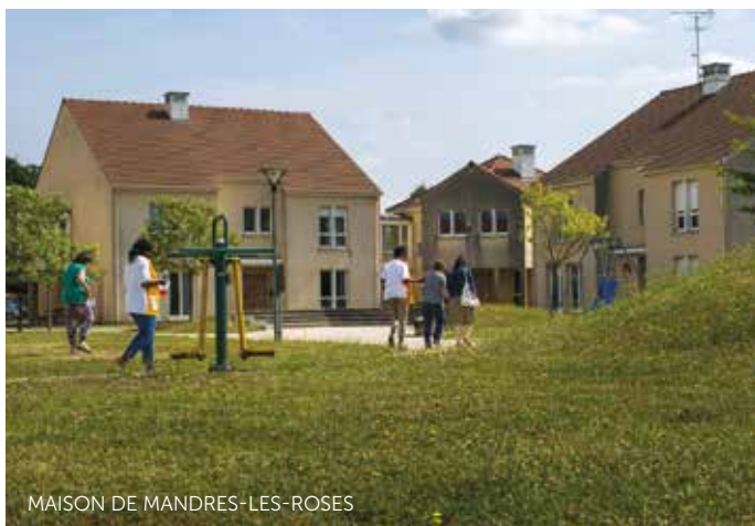
MAISON DE MANDRES-LES-ROSES