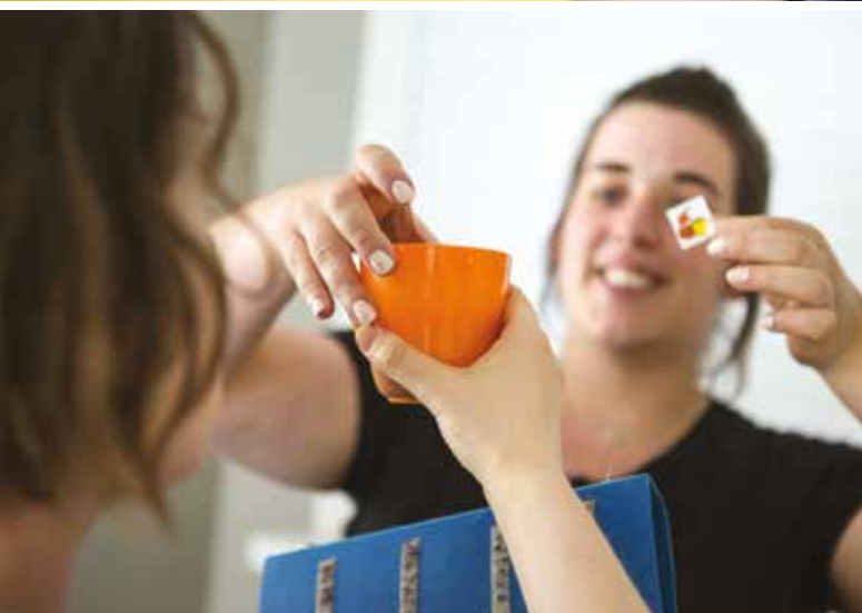
> LES ÉQUIPES PERCE-NEIGE SONT TRÈS IMPLIQUÉES DANS LES ACTIVITÉS EN VEILLANT CONTINUELLEMENT AU BIEN-ÊTRE DES RÉSIDENTS

personnes et pour les équipes est important. Une personne qui n'arrive pas à se faire comprendre développera des troubles du comportement plus fréquents. La méthode permet aussi de faire comprendre le séquençage du temps grâce à un emploi du temps individuel et organisé par tranches horaires. Une sorte d'horloge – un timer – montre le temps passé et le temps restant. « Pour ces personnes qui n'ont aucune notion du temps tout en ayant beaucoup de mal à gérer la frustration, cette approche leur montre qu'après une activité identifiée comme désagréable ou peu intéressante, elles pourront vivre un moment agréable et qu'elles apprécient, comme manger par exemple. Une fois encore, la compréhension réduit le stress et donc les éventuels troubles du comportement. Pour une prise en charge performante, nous réalisons un suivi statistique très précis de chaque incident en cherchant à identifier les facteurs déclencheurs récurrents. Nous avons ainsi noté 27 troubles du comportement par mois en janvier 2018 de la part d'un résident. Après la mise en place d'une intervention éducative, le nombre a été réduit à 4 troubles pour le mois d'octobre. Ce type de résultat permet à un résident de pouvoir participer à de nouvelles activités sociales comme par exemple aller au restaurant en famille et avoir un comportement approprié. Le bénéfice est réellement concret. »