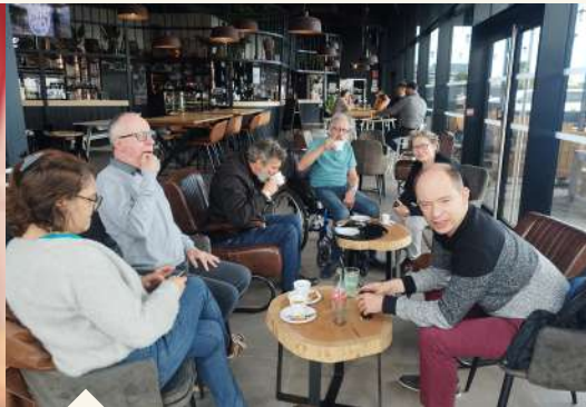
Le White hop café tous les vendredis matins. Maison Perce-Neige de Chauché