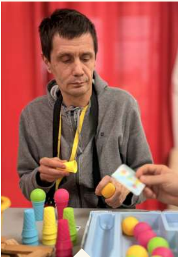
Un jeu haut en couleur ! Maison Perce-Neige de Brissac