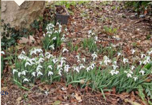
De jolis perce-neiges ont poussé dans le jardin de Saint-Laurent-sur-Gorre ! Maison Perce-Neige de Saint-Laurent-sur-Gorre