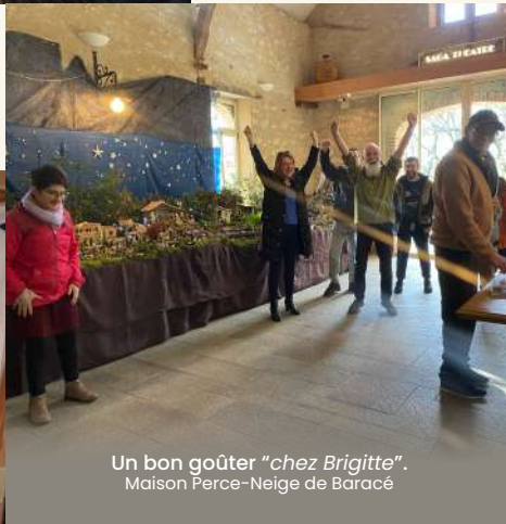
Un bon goûter "chez Brigitte". Maison Perce-Neige de Baracé