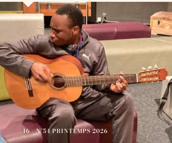
Seny à la Cité de la Musique! Toca la guitarra! Maison Perce-Neige de Paris 14 e