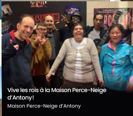
Vive les rois à la Maison Perce-Neige d'Antony ! Maison Perce-Neige d'Antony