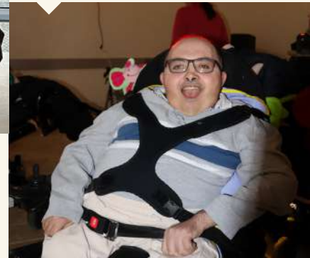
La boum de la maison! Maison Perce-Neige de Cigogné