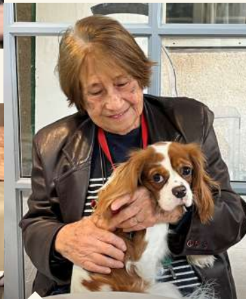
Au "Bistrot" avec GORDON, la mascotte de la Maison! Maison Perce-Neige d'Albi